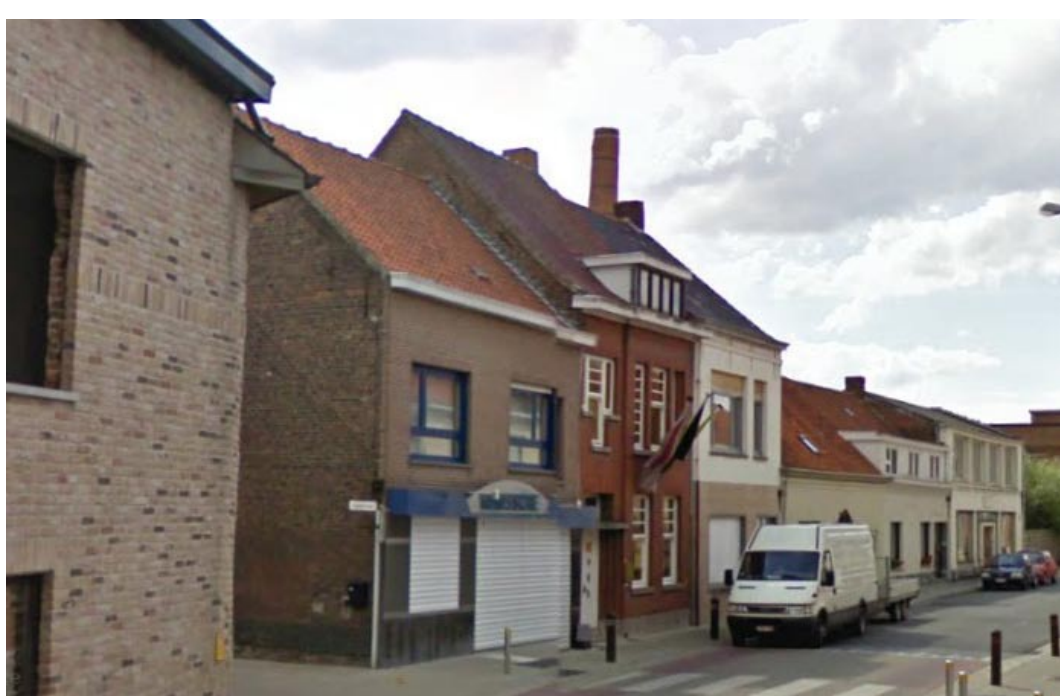
Google streetview 2009