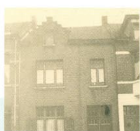
Impressie uit de jaren zestig